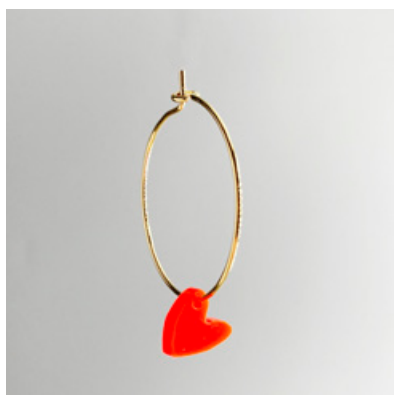
CG 111 Ø 25 mm UVP 21 Euro