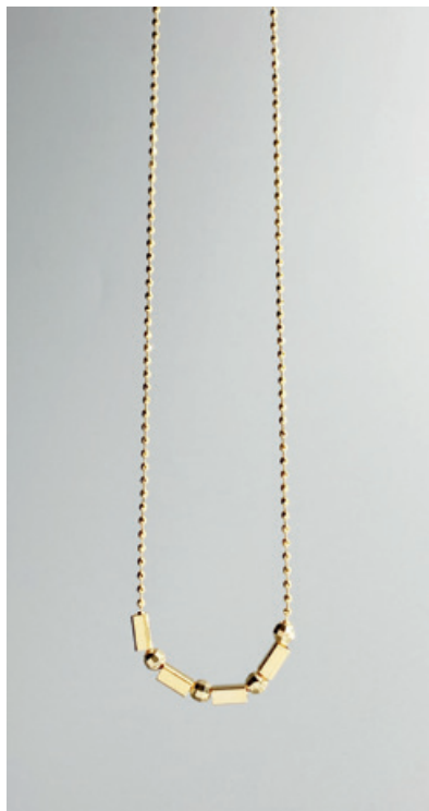
KG101 UVP 32 Euro