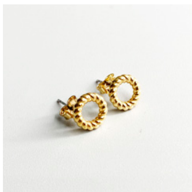
OG 118 Ø 10 mm UVP 21 Euro