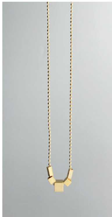
KG119 UVP 32 Euro