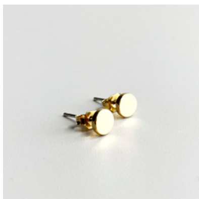
OG 107 Ø 6 mm UVP 16 Euro