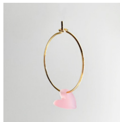
CG 114 Ø 25 mm UVP 21 Euro