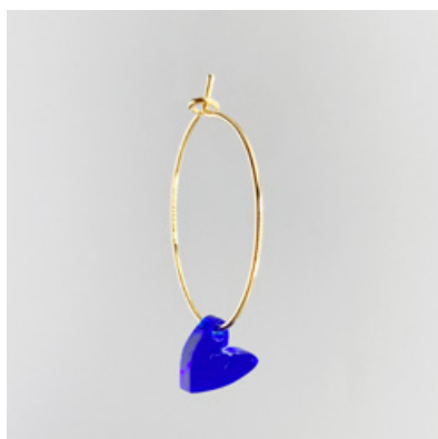
CG 110 Ø 25 mm UVP 21 Euro