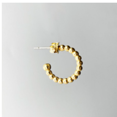
OG 119 Ø 16 mm UVP 21 Euro