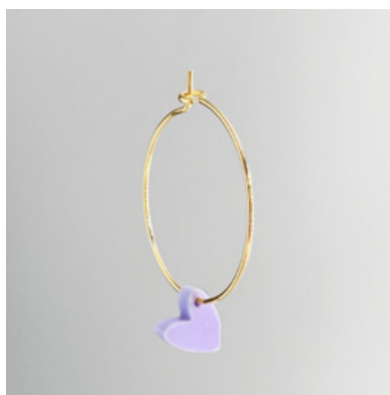
CG 112 Ø 25 mm UVP 21 Euro