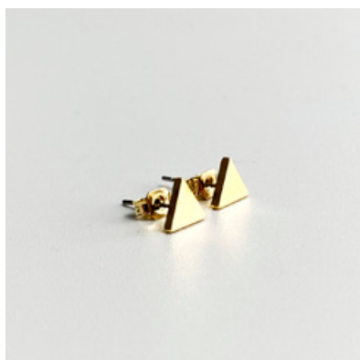
OG 106 7 x 7 mm UVP 21 Euro