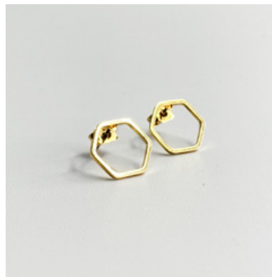
OG 104 12 x 12 mm UVP 19 Euro