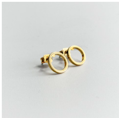
OG 101 Ø 12 mm UVP 21 Euro