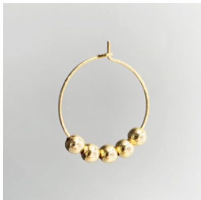
CG 115 Ø 25 mm UVP 21 Euro