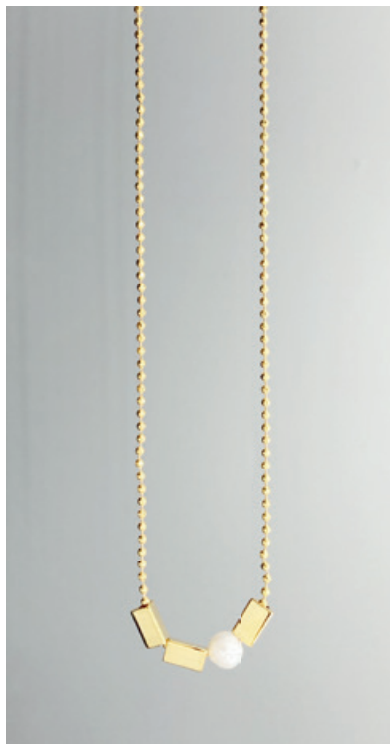
KG117 UVP 32 Euro