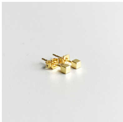
OG 113 3 x 3 mm UVP 19 Euro