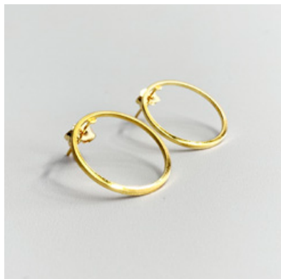
OG 102 Ø 20 mm UVP 21 Euro