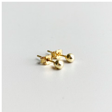
OG 114 Ø 4 mm UVP 16 Euro