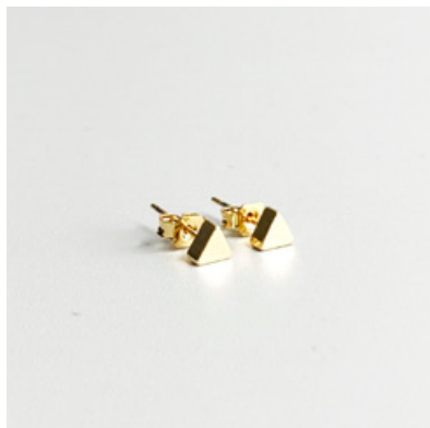
OG 112 5 x 5 mm UVP 19 Euro