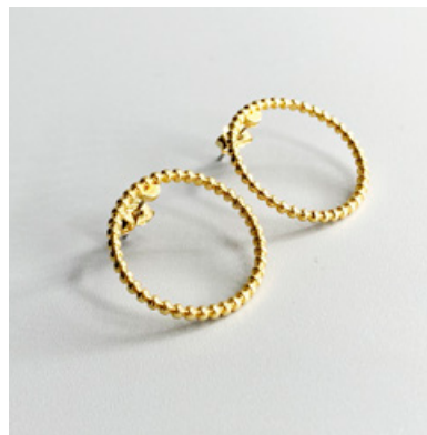
OG 115 Ø 23 mm UVP 25 Euro