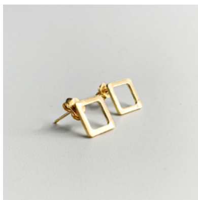
OG 109 10 x 10 mm UVP 19 Euro