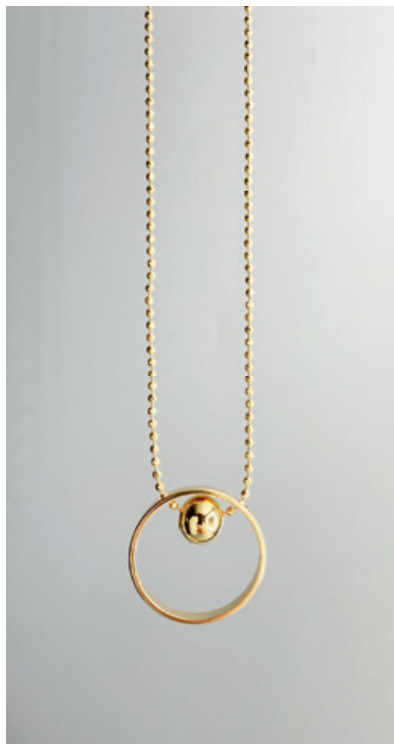
KG112 UVP 32 Euro