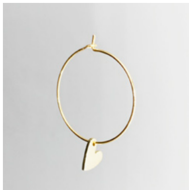
CG 106 Ø 25 mm UVP 21 Euro