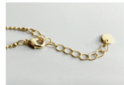
KETTENLÄNGE Alle unsere Ketten haben eine Länge von 40 cm und ein Verlängerungskettchen von 5 cm.