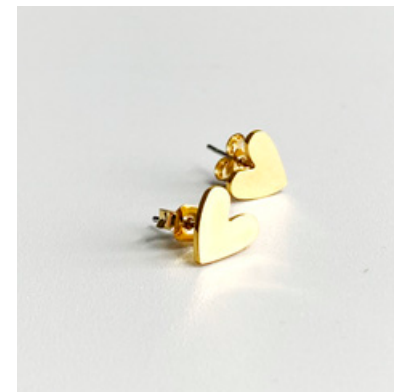
OG 116 8 x 8 mm UVP 19 Euro