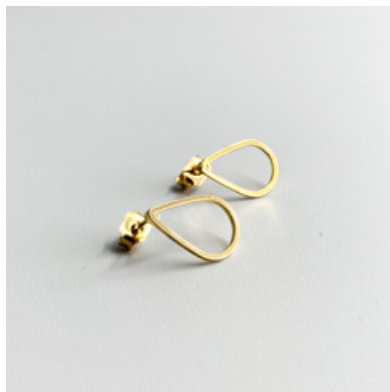
OG 103 10 x 15 mm UVP 19 Euro