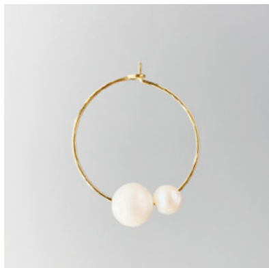
CG 101 Ø 25 mm UVP 25 Euro