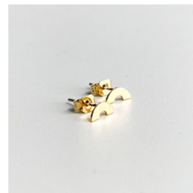
OG 111 8 x 4 mm UVP 16 Euro